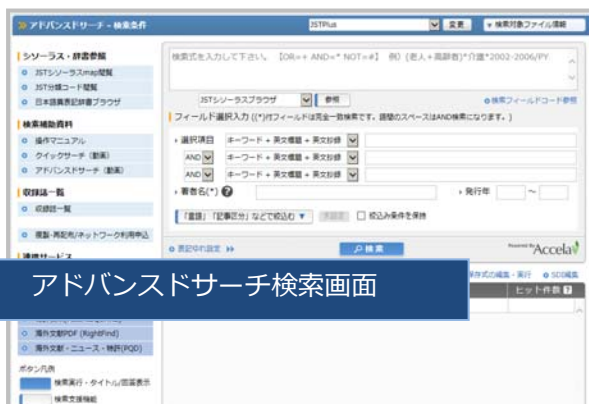
アドバンスドサーチ検索画面

アドバンスドサーチでは、さまざまな検索補助機能を駆使した精度の高い検索や、さまざまな項目に限定した検索が可能です。詳細は検索ガイドをご確認ください。